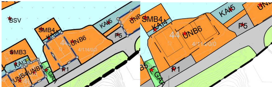
Bildet viser byggegrense for UNB6 med feil

I plankartet var byggegrense til naustområde UNB6 feil. For å unngå framtidige mistydingar, vert denne no lagt korrekt inn i plankartet.