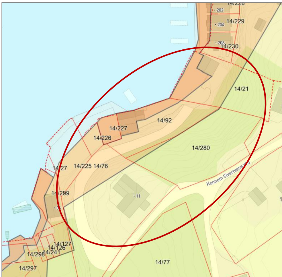
Figur 2 Utsnitt av gjeldande kommuneplan