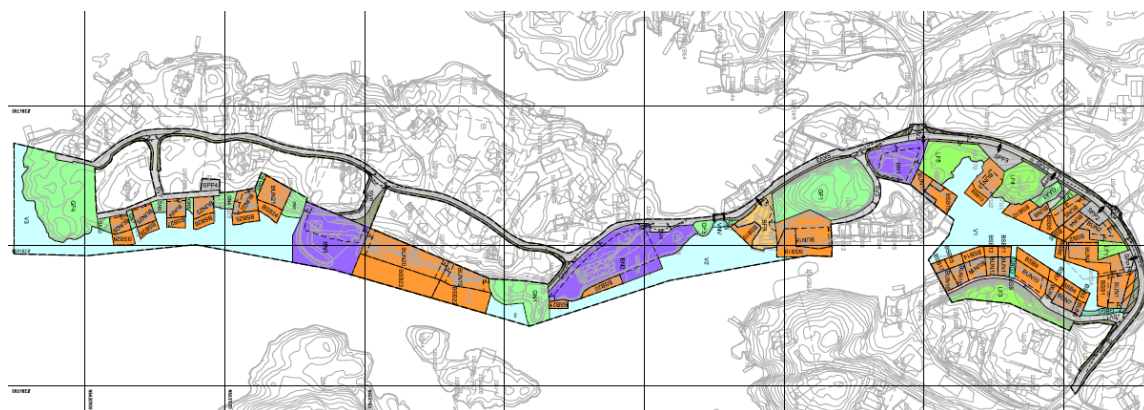
Figur 3 - Utsnitt frå siste revisjon av plankartet i 2023.