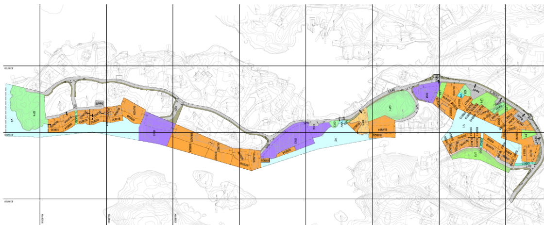
Figur 2 - Utsnitt frå plankartet som var på høyring i 2020.

Statsforvaltaren fremja motsegn til planforslaget i brev datert 01.12.2020. Det har ikkje vore gjennomført dialogmøte i høyringsfasen. Det har vore sendt over revidert planforslag tre gongar tidlegare, men der motsegna til Statsforvaltaren har stått ved lag, jf. breva deira datert 28.04.2021, 04.05.2022 og 24.01.23.